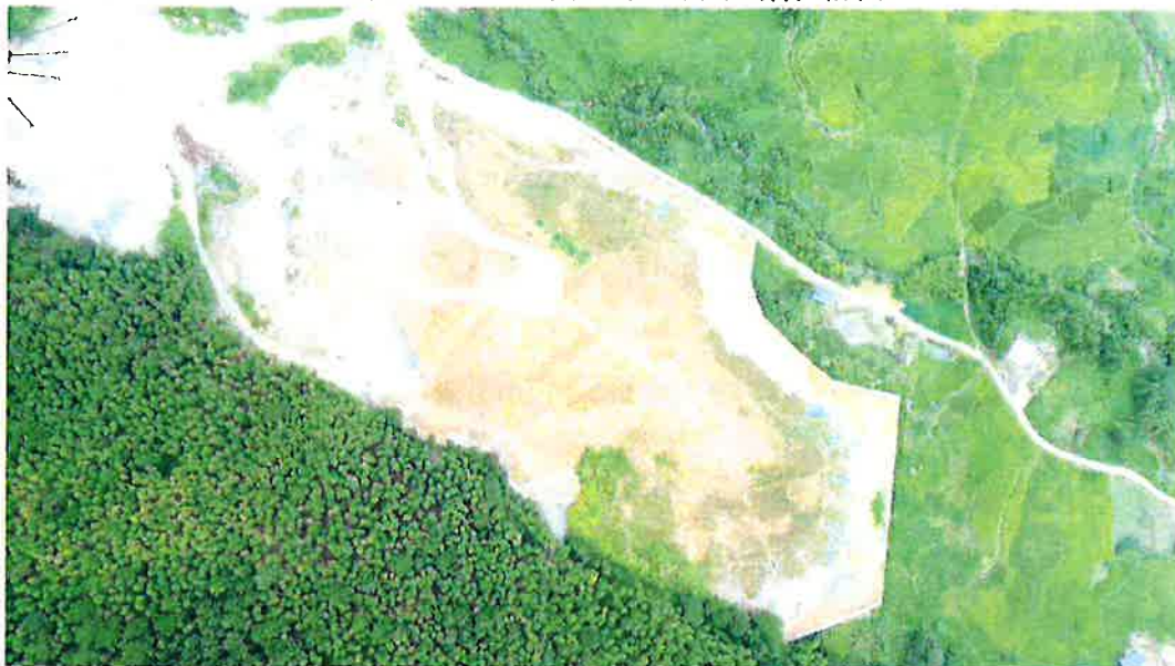
2023年10月文笔山1号隧道2#弃渣场航拍图