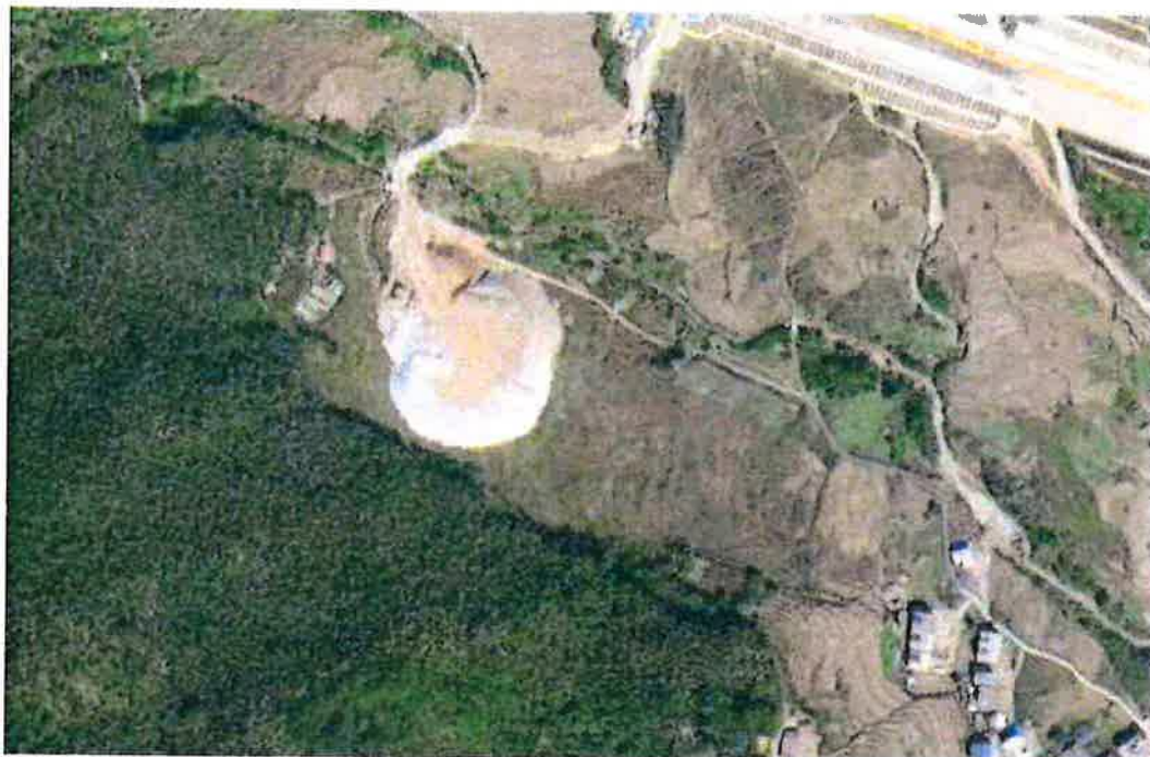
2020年6月文笔山1号隧道2#弃渣场谷歌影像图